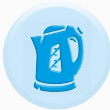
КНОПКИ БЫТОВЫХ ПРИБОРОВ