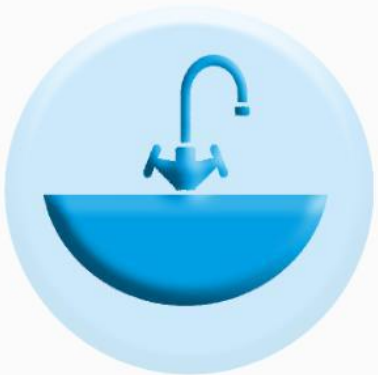
РАКОВИНЫ И СМЕСИТЕЛИ