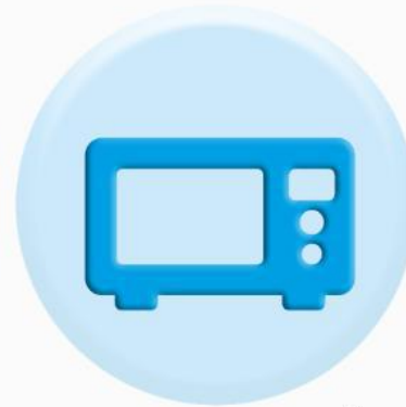
ПАНЕЛИ БЫТОВОЙ ТЕХНИКИ