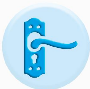
РУЧКИ ДВЕРЕЙ И ШКАФОВ

ТО, К ЧЕМУ МЫ ПРИКАСАЕМСЯ ЧАЩЕ ВСЕГО ДОЛЖНО БЫТЬ ЧИСТЫМ