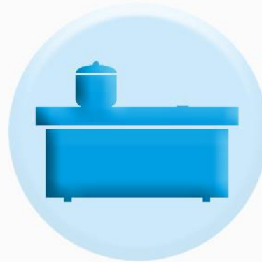
ПОВЕРХНОСТИ СТОЛЕШНИЦ, ПОЛОК