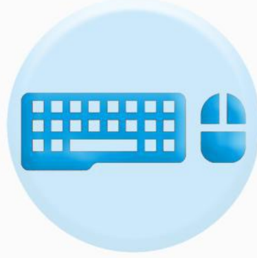
КЛАВИАТУРА ОРГТЕХНИКИ И МЫШКА