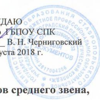
График учебного процесса на 2018-2019 учебный год для обучающихся, осваивающих образовательную программу подготовки специалистов среднего звена, очная форма обучения